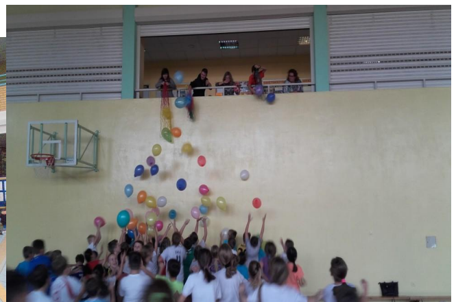
Impreza integracyjna dla klas czwartych- „Klasy czwarte na start „