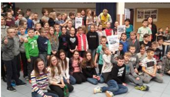
PODSUMOWANIE KONKURSU NA NAJLEPSZĄ KLASĘ

Ile nóg ma pies? 8: 2 z prawej, 2 z lewej 2 z przodu i 2 z tyłu!